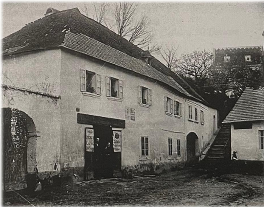
Das Haus am Kirchenplatz 4 (früher Nr. 109. sowie Nr. 105 und 106) um 1900