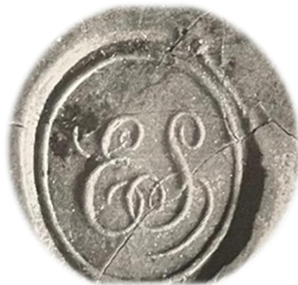
Siegel von E. Schuender